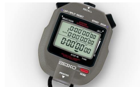
ストップウォッチ