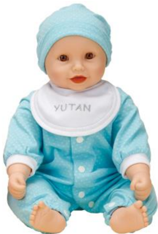
保育人形（衣服着用） 敷物